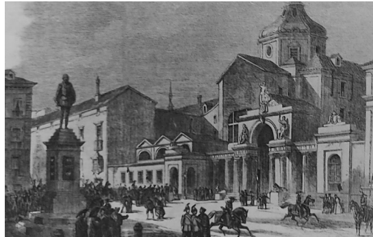
El edificio del Congreso, donde ha sido aprobado el Código Civil

política de los partidos liberal y conservador que alternan en el poder. En él se ve reflejado el liberalismo conservador que se manifiesta especialmente en la regulación de instituciones como la propiedad, la herencia o la libertad contractual.